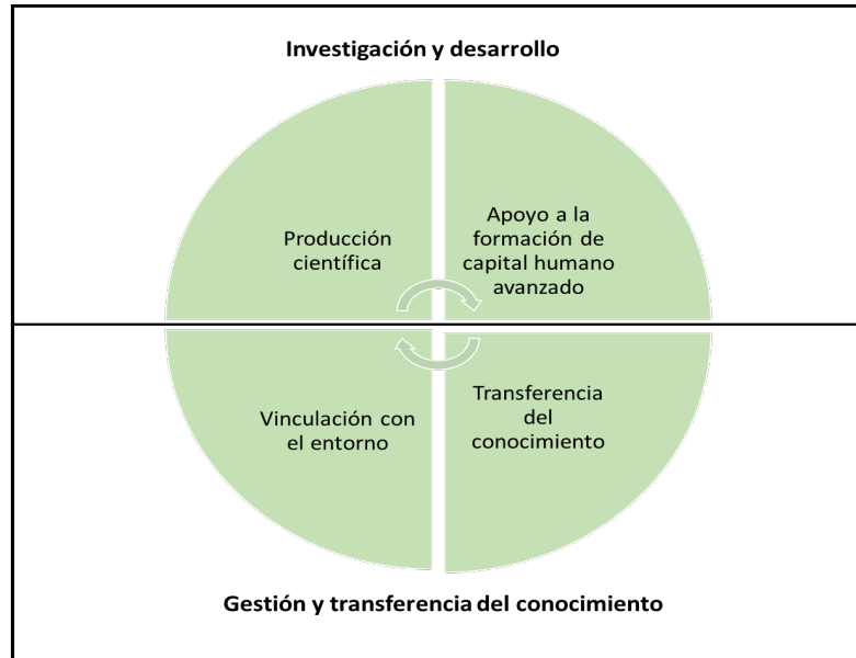
Figura 2. Representación de las cuatro áreas de trabajo de CEAZA.