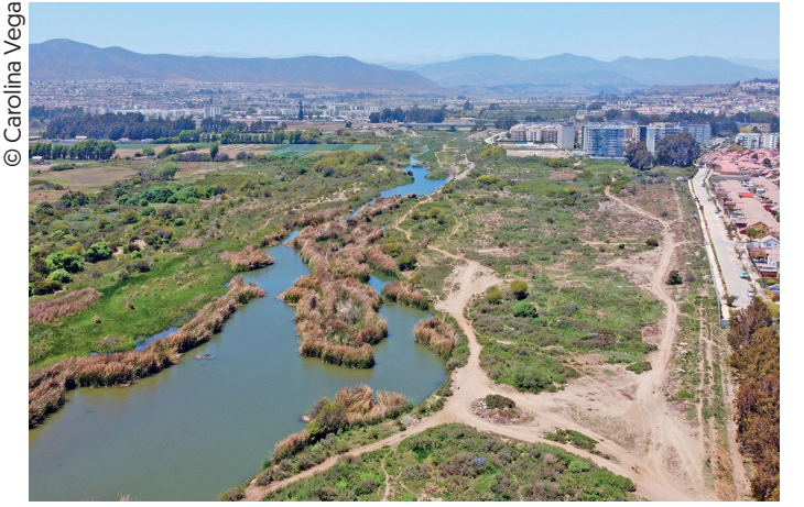
Humedal Río Elqui