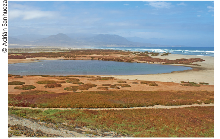
Humedal La Boca