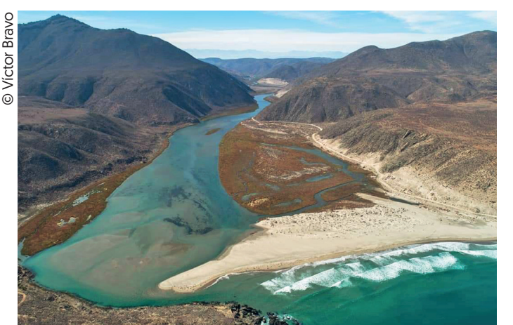
Humedal Río Limarí