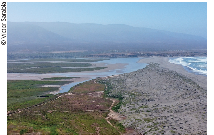
Complejo de Humedales Las Salinas de Huentelauquén