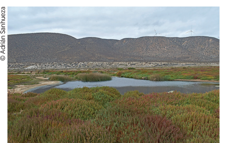
Humedal El Teniente