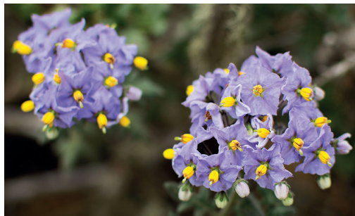
Tomatillo / Solanum pinnatum