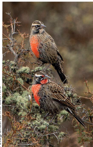
Loica / Leistes loyca