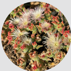
Rocío / Mesembryanthemum crystallinum