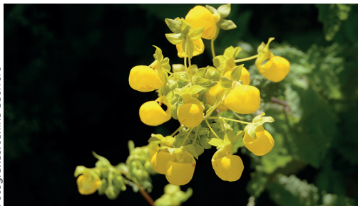
Capachito / Calceolaria sp.