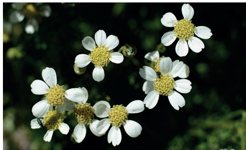
Chamiza / Bahia ambrosioides