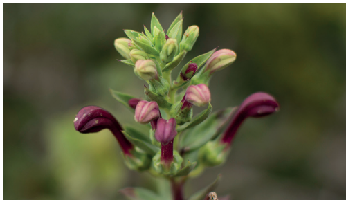
Tabaco del Diablo / Lobelia excelsa