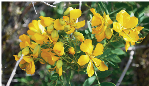
Alcaparra / Senna cumingii