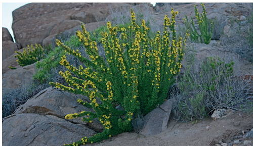
Churqui / Oxalis gigantea