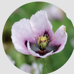
Amapola / Papaver somniferum