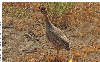
Perdiz chilena Nothoprocta perdicaria