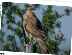
Tiuque / Milvago chimango