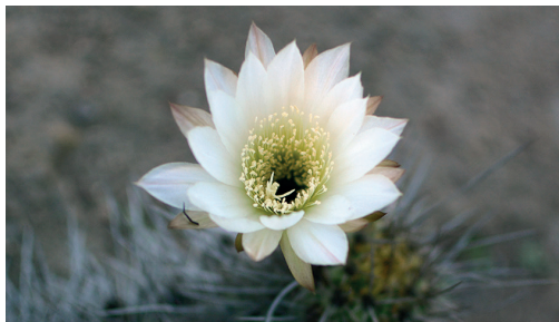
Copao / Eulychnia breviflora