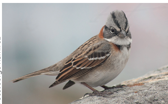
Chincol / Zonotrichia capensis