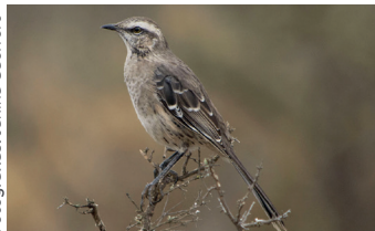
Tenca / Mimus thenca