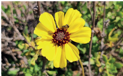
Coronilla de fraile / Encelia canescens