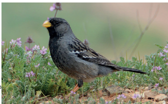
Yal / Rhopospina fruticeti fruticeti