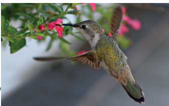
Picaflor del norte / Rhodopsis vesper