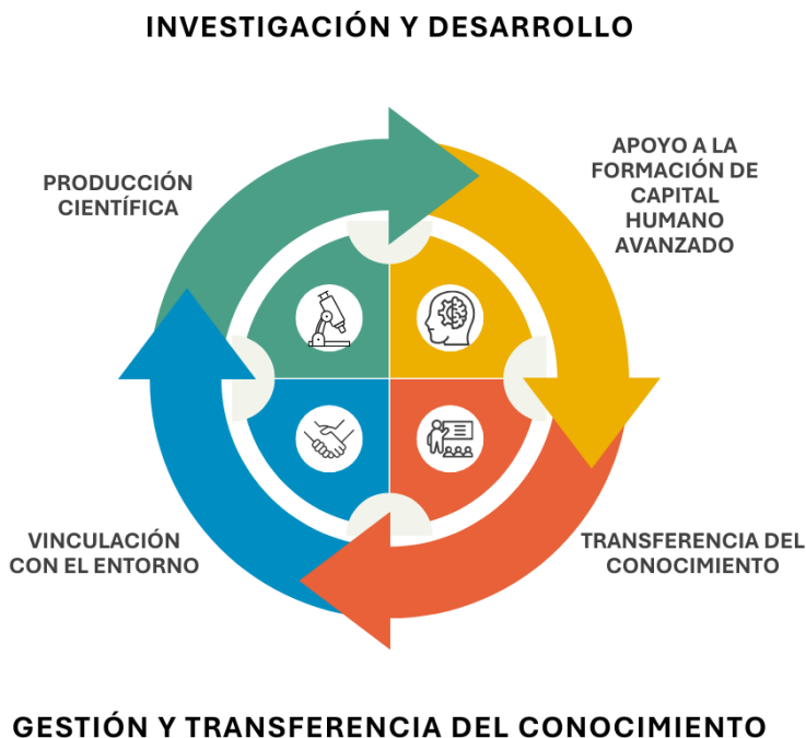
Figura 2. Representación de las cuatro áreas de trabajo de CEAZA.

Las áreas de trabajo de CEAZA, definidas por sus cuatro instituciones socias fundadoras, están relacionadas con las siguientes áreas de impacto: i) Producción científica, ii) Apoyo a la formación de capital humano, iii) Vinculación con el entorno, iv) Transferencia del Conocimiento (Figura 2)